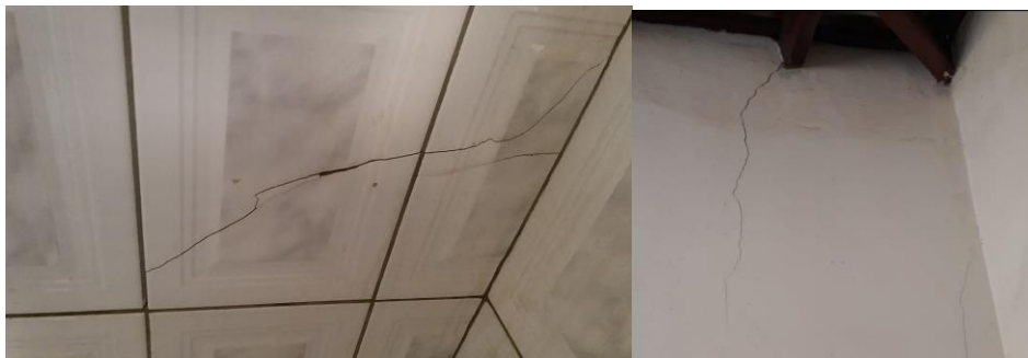
Figura 4 - Trincas em pisos e trinca próxima ao telhado

O aparecimento de fissuras é sinal de que foi excedida a resistência a tração do material e deve se averiguar. Apareceu em 15% dos casos, segundo Souza e Ripper (1998) é o dano de ocorrência mais comum e aqueles que, a par das deformações muito acentuadas, mais chama a atenção dos leigos, proprietários e usuários aí incluídos, para o fato de que algo de anormal está a acontecer.