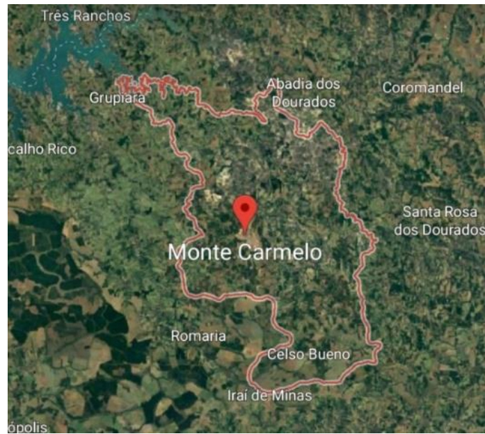
Figura 1 - Localização do município de Monte Carmelo