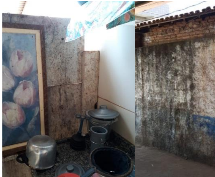
Figura 7 - Mofo e bolor na pia e quintal