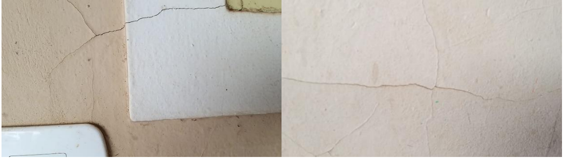
Figura 3 - Fissura na janela e parede