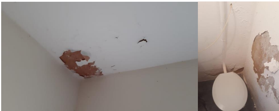
Figura 6 - Infiltração no telhado e banheiro

As rachaduras (8% dos casos) principalmente as em diagonais indicam que algo grave pode está acontecendo, podendo ser em consequência do excesso de peso, modificações estruturais e até mesmos podem ser causados por ralos entupidos podem causar danos severos.