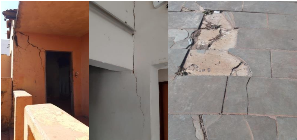
Figura 5 – Rachaduras em paredes e pisos