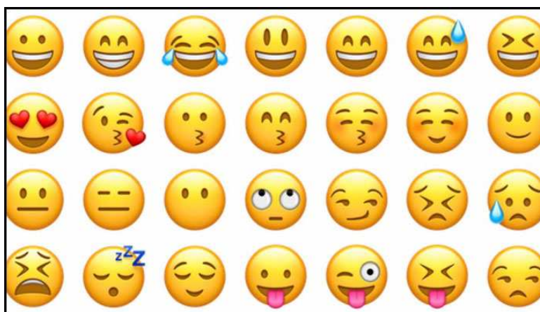
Figura 1 Emoticons utilizados nas conversas via internet.

Essas “carinhas” são alguns dos emoticons do Whatsapp, que podem substituir a escrita como uma forma de expressar os sentimentos. Para entender melhor essa linguagem, é necessário que os professores de Língua Portuguesa estejam conectados a essas mudanças e levem para a aula de aula, discutam com os alunos, apresentando, a partir disso, as diversas formas de trabalhar a língua, seja ela oral ou escrita.